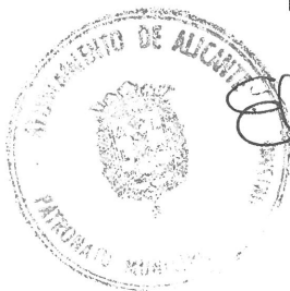
Fdo.: Elena Lumbreras Peláez